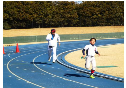
お父さんも頑張りました！