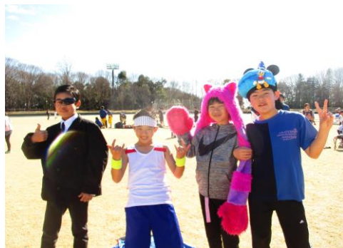
仮装をするチームも!(^^)!